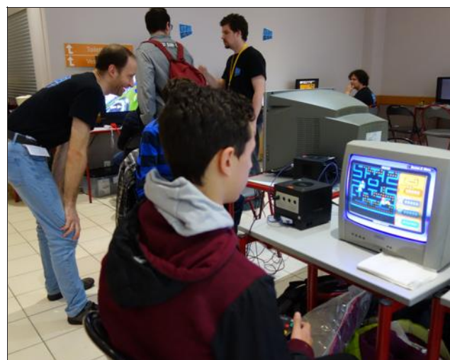
■ Le "rétro-gaming" n'a pas été oublié.

Vous ne jouez pas à ce genre de jeux ou les gamers vous ont donné envie de jouer à votre tour ? Les organisateurs d'Epsilon y ont pensé : pour se "consoler", ils ont installé un coin jeux à la sortie de la grande salle. L'association lyonnaise G2L2, dont l'objectif est de « promouvoir la culture geek à