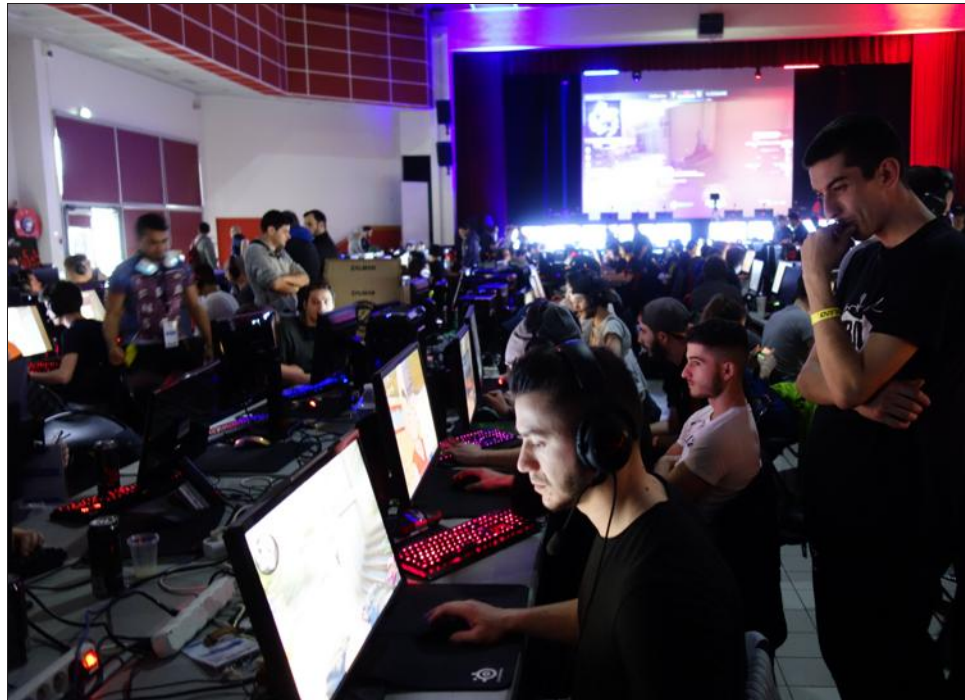
■ 260 joueurs s'affrontent sur petit et grand écran jusqu'à ce soir.

Bienvenue à la 14 e édition d'Epsilon, un grand rendez-vous de "gamers" (joueurs) d'e-sport (sport électronique) qui ouvre la saison du très sérieux circuit des Masters du genre. Les joueurs, qui incarnent des soldats, s'affrontent non-stop, en équipes, sur le jeu Counter-Strike (version "Global offensive"). Un trophée et plusieurs milliers d'euros sont en jeu. Certaines équipes sont composées de joueurs